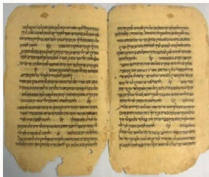
כתב יד ימיני של ספר המצוות לרמב"ם

יום ביומו: "בחיכון ובוימויכון ובחיי דרבנא משה בן מימון", שהאיר עיניהם בתורה ובטל מעליהם גזרות קשות וכובד מיסים. אגרת תימן מתארת גם את חיי הרוח בתימן בחיי הרמב"ם. הוא משבחם כבעלי צדקה וכלומדי תורה, ההולכים בדרך חכמי התלמוד, מקיימי מצוות ומדקדקים על קלה כבחמורה. גם אחרי מותו, המשיך הרמב"ם להיות נערץ ע"י יהודי תימן וכתביו ופסקיו היו נר לרגליהם עד היום הזה.