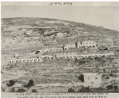
כפר התימנים בשילוח, 1891.

ביקרנו עם הטייס בירושלים, במנהרות הכותל עם רב הכותל, בבית הנשיא, בכנסת עם יו"ר הכנסת ב"ד ושם" ואין ספק שירושלים גרמה לו להתרגש עד דמעות. זאת ירושלים העיר שבחודש אייר נציין בשמחה את "יום שחרור" העיר בכ"ב באייר. זאת ירושלים אשר שגירות ארה"ב בישראל תעבור אליה ביום בו הכריז דוד בן גוריון על הקמת מדינת ישראל. זאת ירושלים אליה הגיעו עולים מתימן כבר בשנת 1881 והתיישבו בפאתיה ובתוכה.