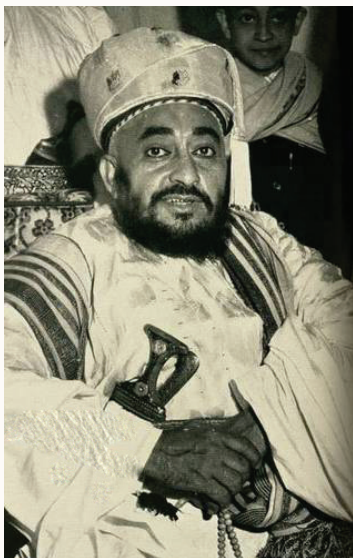
אחמד בן יחיא

בן יחיא כי הוא הופך את המדיניות שהייתה נוהגת על ידי אביו האימאם יחיא (אשר נרצח ע"י קושרים) וכי "מערתה כל יהודי אשר ברצונו לצאת את תימן לצמיתות רשאי לעשות זאת, לבנאי שימכור תחילה את רכושו".