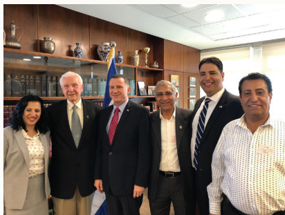
הטייס עם חברי הכנסת

לונג, שהיה נווט, השתתף ב-12 טיסות להעלאת יהודי תימן. "בגלל שהם היו בסכנת חיים, טסנו בלי הפסקה. גם בשבתות. לא הגשנו תוכנית טיסה, לא אמרנו לאף אחד שאנחנו הולכים, הכול היה סודי. שום דבר לא היה בעיתונים או ברדיו על כך. פשוט טסנו דרך הים האדום כדי שאף אחד לא יוכל לראות אותנו. פנינו לכיוון מפרץ עקבה ונשארו במרכזו. כאשר הגענו למה שקראנו בזמנו אום רשרש (כיום אילת), הסתובבנו ופנינו לבאר שבע. מבאר שבע יכולנו לעשות את דרכנו לתל אביב", סיפר.