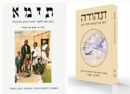
(ראה מודעה עמוד 5)