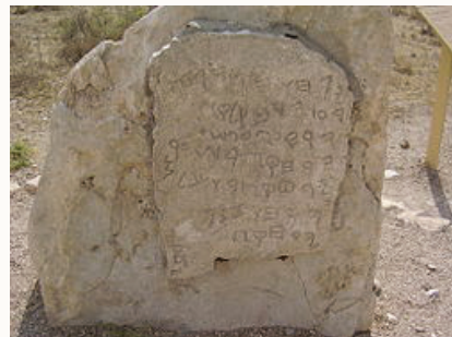
העתק הלוח בתל גזר.

ואל הניצנים בשדות אפשר להוסיף גם את נצנוצי זיו השמש הזוהרים בעונה זו. גם השם 'אייר', כמו שאר חדשי השנה, מקורו באכדית AYARU - , מזכיר בשמו את אור השמש השופע בחודש זה. לוח גזר הוא לוח מתקופת שלמה המלך ובו כתובת המתארת פעולות חקלאיות לאורך חדשי השנה; וכך כתוב על חודש אייר שבו קוצרים את השעורים: "ירח. קצר. שערמ". הכתובת נגזלה ע"י השלטון התורכי, וכיום היא נמצאת במוזיאון באיסטנבול. בימינו יצרנו