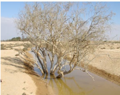
רותם המדבר

ניתוח המקרה הרפואי מעלה שמדובר בתינוק שנולד בריא עם רמת בילורובין של כ-15 מ"ג. האב חפץ לקיים את טקס ברית המילה ביום השמיני להולדתו, ורצה "להאיץ" את הטיפול בצמח הרותם. בניגוד להוראות, הוא נתן לבנו מינון של כ-20 מ"ל (1) מהתמצית המרוכזת. בטיפול נמרץ הצליחו הרופאים לייצב את מצבו ולאחר כיממה והוא יצא מכלל סכנה. מסקנות החוקרים מהמקרה הזה היא שיש להיזהר משימוש בלתי מבוקר בצמח זה. המקרה שתיארנו הוכיח שברפואה מסורתית וקונבנציונלית כאחד, יש להקפיד להשתמש במינון המדויק, וחריגה מכך עשויה להיות מסוכנת.