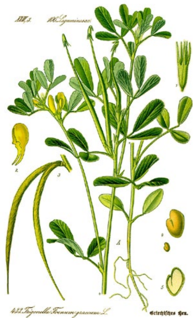
צמח החיילבה, מתוך הספר Thomé Flora von Deutschland, Österreich und der Schweiz, מאת פרופ' אוטו וילהלם, גרמניה 1885

זוהי דוגמה נוספת לחיזוק המסורת שכתב מהרי"ץ בחיבוריו כי מנהגי התפילה התימניים מתקופת בית המקדש הראשון: "ומנהג זה מנהג קדמונים דקדמונים כמעט מימי הבית, כמקובל בידנו מאבותינו, שכל מנהגותינו בעניני התפילות מימות חרבן בית ראשון" (תכלאל עץ חיים, חלק ב' שחרית לפסח, דף ל"ה ע"ב ועוד). נהגו גם יהודי ג'רבה שבתוניס לשנות את המים של החיילבה.